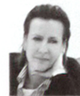
Автор проекта: дизайнер-архитектор Елена Романова

ВЛАДЕЛЬЦЫ УЧАСТКА В ПОДМОСКОВНОМ КОТТЕДЖНОМ ПОСЕЛКЕ ДУХАНИНО ОБРАТИЛИСЬ К ДИЗАЙНЕРУ-АРХИТЕКТОРУ, КОГДА КОРОБКУ ДЕРЕВЯННОГО СТРОЕНИЯ УЖЕ ВОЗВЕЛИ. ТРЕБОВАЛОСЬ ПРЕВРАТИТЬ ЕЕ В УЮТНЫЙ СВЕТЛЫЙ ДОМ, ГДЕ ХОЗЯЕВАМ БЫЛО БЫ КОМФОРТНО ЖИТЬ И ОТДЫХАТЬ В ЛЮБОЕ ВРЕМЯ ГОДА. В РЕЗУЛЬТАТЕ ПОСТРОЙКА ПРЕТЕРПЕЛА ДОВОЛЬНО СЕРЬЕЗНЫЕ ПРЕОБРАЗОВАНИЯ, А В ЭКСТЕРЬЕРЕ И ИНТЕРЬЕРЕ ВОПЛОТИЛИСЬ ЧЕРТЫ СРЕДИЗЕМНОМОРСКОГО СТИЛЯ С ЛЕГКИМИ ВИНТАЖНЫМИ МОТИВАМИ.