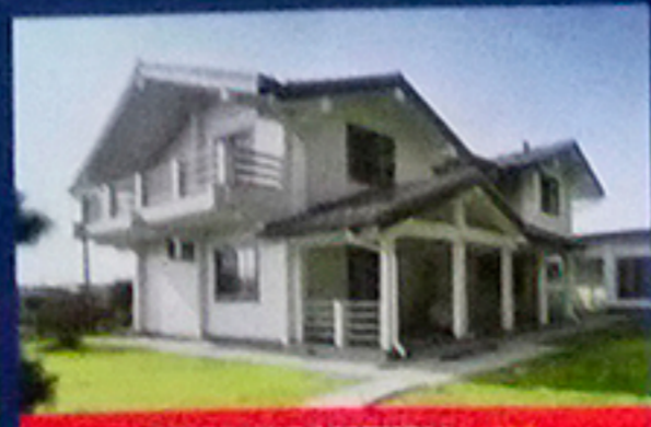
ЯПОНСКИЕ МОТИВЫ с. 14