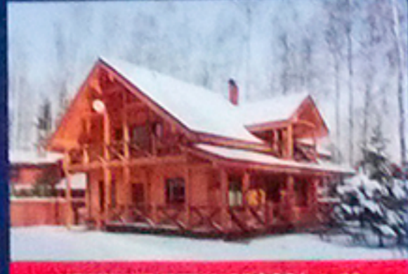
ИЗЯЩНАЯ МЕТАМОРФОЗА с. 60

реализованные проекты ведущих архитекторов • технологии • конструкции • модные тенденции • дизайн-концепция • защитные средства