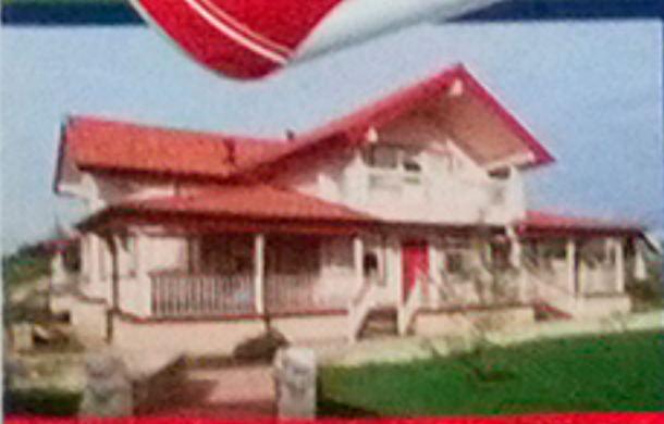
В СТАРОДАЧНОМ СТИЛЕ с. 46

XI международная выставка 26-29 марта 2015 г. Москва, «Крокус Экспо»